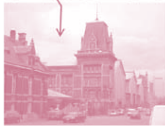
Maritiemstation Gare Maritime