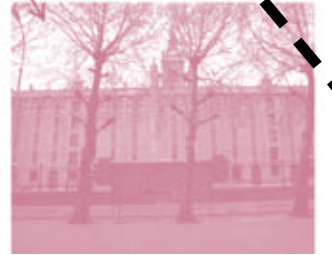
Koninklijk Pakhuis Entrepôt Royal

ENVIE D'EN SAVOIR D'AVANTAGE ? LISEZ LE TEXTE COMPLET SUR WWW.BRALVZW.BE/NODE/348