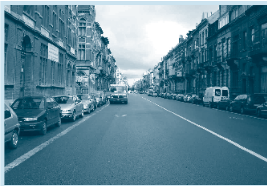
Buurtbewoners vragen meer plaats voor fietsers en openbaar vervoer op de Kroonlaan.

Het stuk van de Kroonlaan tussen het Blijckaertsplein en de Generaal Jacqueslaan krijgt binnenkort een nieuw kleedje. Het openbaar onderzoek en de overlegcommissie zijn achter de rug en we wachten op de resultaten. Ondertussen bleven de buurtbewoners niet bij de pakken zitten. Ze lieten een petitie rondgaan en die leverde al vierhonderd handtekeningen op. Surf naar W www.lapetition.be/petition.php?petid=632 als jij ook vindt dat het openbaar vervoer een eigen bedding verdient