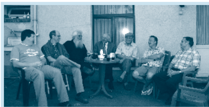
Neerpede Blijft! vergadert: lachen & discussiëren.