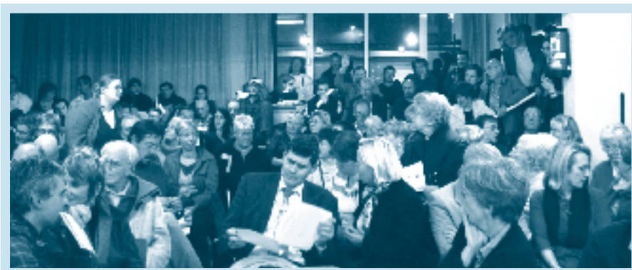
De nood aan overleg over de huisvestingsprojecten in Heembeek is duidelijk merkbaar.

Je kunt je mening geven over de noden van Heembeek en de maatregelen die er moeten komen via een vragenlijst die Bral en Ieb aanbieden op W www.bralvzw.be . We bezorgen je ideeën aan de bevoegde overheid.