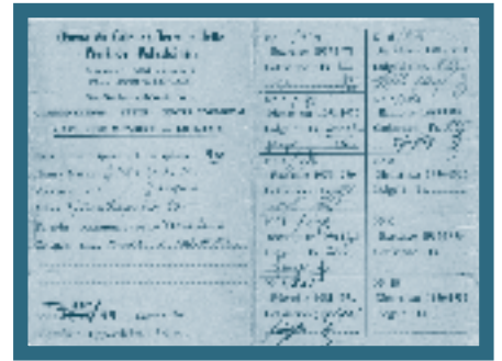
De lidkaart van de oudste volkstuinters van de Schaapengarden!

Een 'passende beoordeling', voorgeschreven door de Europese wetgeving, moet ons binnenkort vertellen of het project negatieve effecten zal hebben op het Natura-2000 gebied. Voor ons is er nog een andere vraag: is dit project nodig? Groen en volkstuintjes opofferen doe je tenslotte niet zomaar. En als we de redenen moeten zoeken in de inkomsten uit de kantine, dan lijkt dat niet zo zwaar te wegen. Als de Vgc dan toch geld wil neerleggen voor de club, waarom dan niet gewoon de subsidies verho-