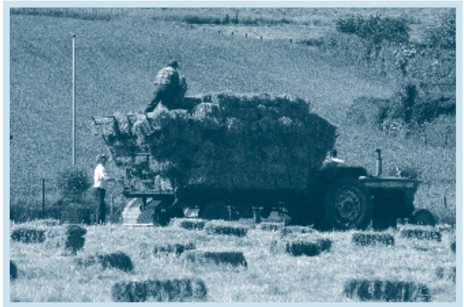
We hoeven niet overhaast te bouwen in Neerpede. De tijd mag gerust nog even stilstaan.