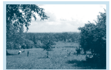
Neerpede, een mythisch stukje periferie