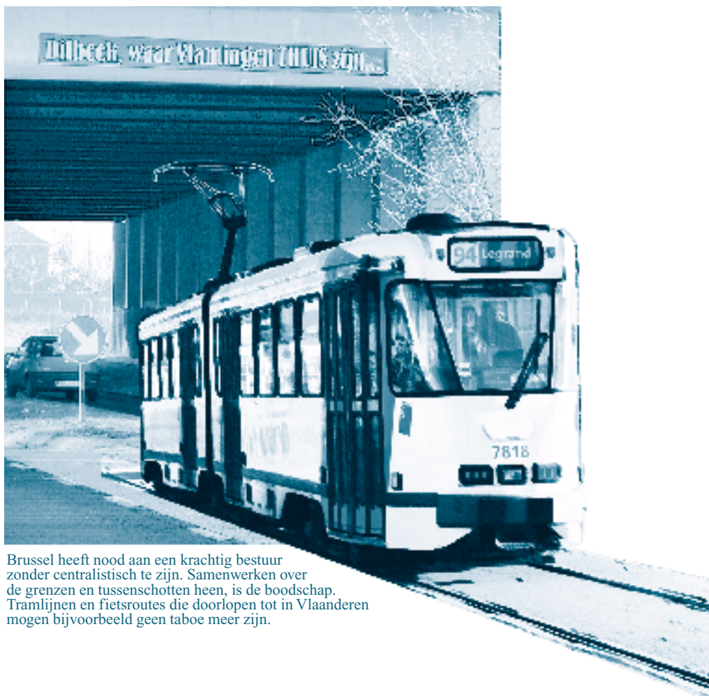
Brussel heeft nood aan een krachtig bestuur zonder centralistisch te zijn. Samenwerken over de grenzen en tussenschotten heen, is de boodschap. Tramlijnen en fietsroutes die doorlopen tot in Vlaanderen mogen bijvoorbeeld geen taboe meer zijn.

Je vindt het memorandum van Bral op www.bralvzw.be >> Memorandum 2009-2014 of contacteer ons als je graag de mooi uitgegeven papieren versie ontvangt.