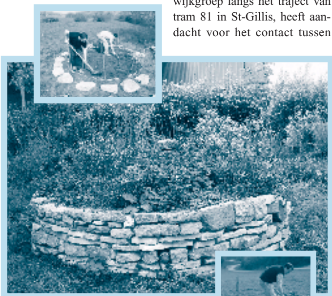
Forest Verts legt binnenkort een 'spirale sauvegarde' aan zoals deze hier, een klein, ruw metselwerk, opgevuld met droge en arme aarde. Planten en dieren kunnen rond de ruwe stenen een schuilplaats vinden.